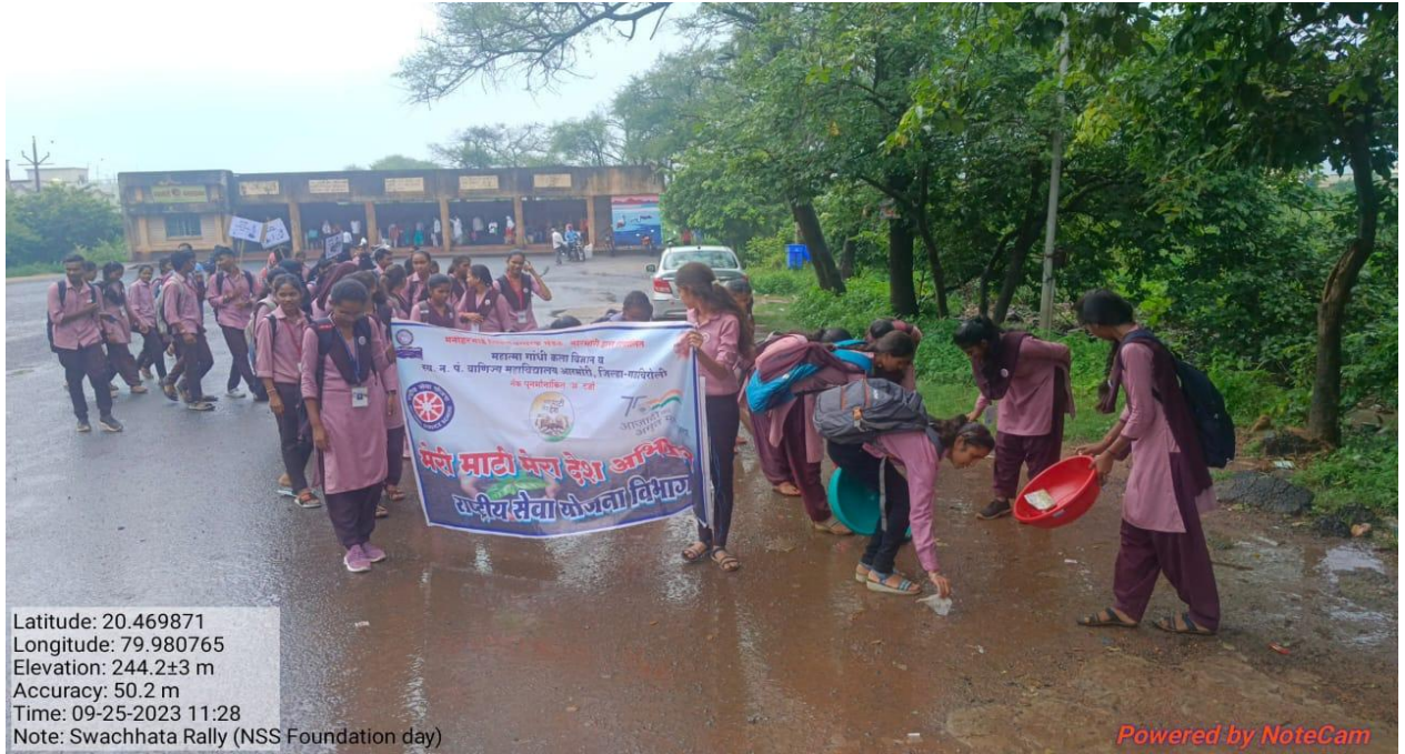
Latitude: 20.469871 Longitude: 79.980765 Elevation: 244.2±3 m Accuracy: 50.2 m Time: 09-25-2023 11:28 Note: Swachhata Rally (NSS Foundation day)