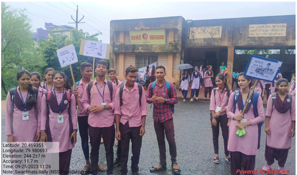
Latitude: 20.469351 Longitude: 79.980693 Elevation: 244.2±7 m Accuracy: 11.7 m Time: 09-25-2023 11:26 Note: Swachhata Rally (NSS Foundation day)